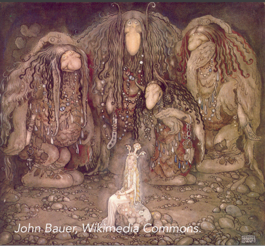
John Bauer, Wikimedia Commons.