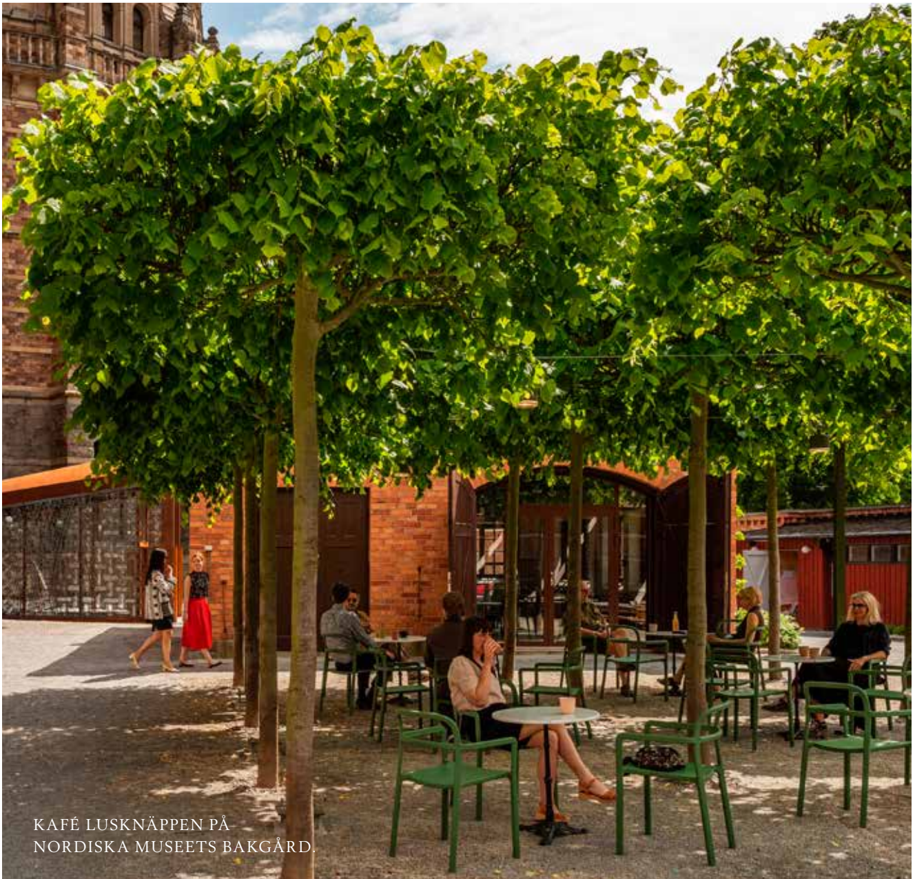
KAFÉ LUSKNÄPPEN PÅ NORDISKA MUSEETS BAKGÅRD.

NORDISKA MUSEET OCH SKANSEN SER FRAM EMOT MÅNGA SVENSKA BESÖK NÄR VI RESER PÅ HEMMAPLAN.