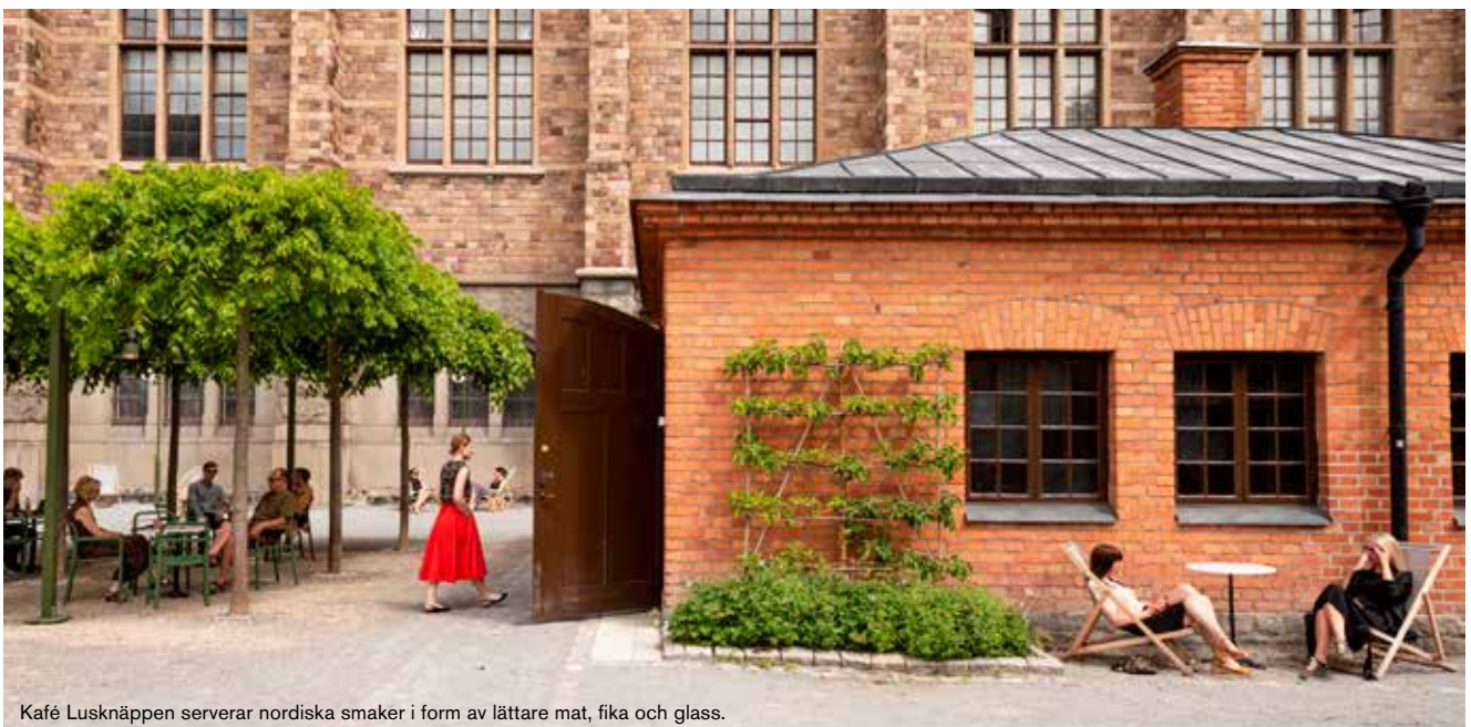
Kafé Lusknäppen serverar nordiska smaker i form av lättare mat, fika och glass.

Arbetet med bakgården är ett samarbete mellan Nordiska museet, Statens konstråd, Kungliga Djurgårdens Förvaltning och projektet Nationalstadsparkerna/ Länsstyrelsen Stockholm.