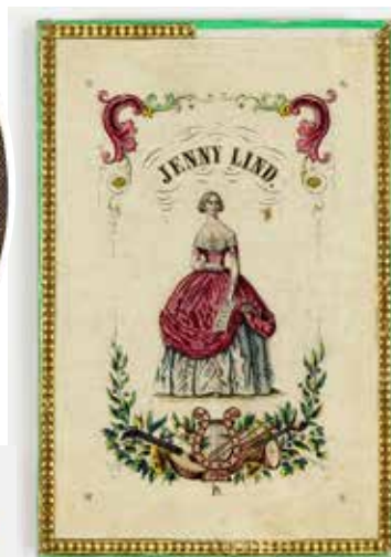
Pappersdocka från 1840-50-tal föreställande Jenny Lind. Dockan ligger i sin originalkartong tillsammans med tio kolorerade dräkter och huvudprydnader från olika huvudroller.