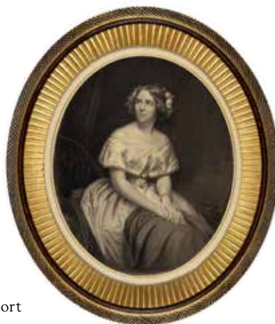
Jenny Lind (original gjord av Eduard Magnus år 1846). Här i svartkrita gjord av Maria Röhl, Tyskland, 1874.

JENNY LIND (1820–1887) är Sveriges första stora musikexport – långt innan ABBA, Robyn och Avicii. När hon var mellan 17 och 28 år sjöng Jenny Lind på de största scenerna i Sverige, Tyskland, Österrike, Danmark, England och USA. Hon utnämndes till hovsångerska vid endast 19 års ålder. 1850–51 genomförde hon en 18 månader lång utsåld konsertturné i USA och Kanada där hon lanserades som "The Swedish Nightingale". När hon anlände till New York stod drygt 25,000 personer på kajen för att få se en skymt av henne.