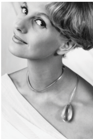
Bild ur utställningskatalogen.

För information och pressbilder, se pressens sida på www.nordiskamuseet.se