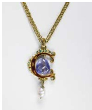
Guld-korn- nr 2