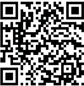
Smycken – webbplatsen smycken.nordiskamuseet.se