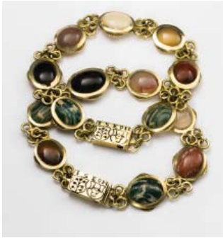
Tidslinje – nr 3

fanns också stränga regler kring vem som fick arbeta med guld, emalj och ädelstenar.