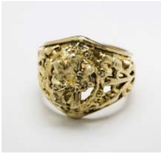
Tidslinje – nr 1