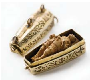
Guldorn - nr 7