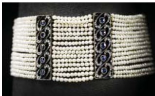
Tidslinje – nr 19