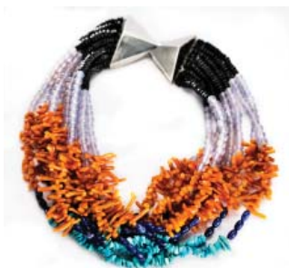
Tidslinje – nr 23