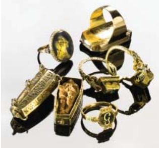
Guldorn - 4, 6, 7, 8, 9,