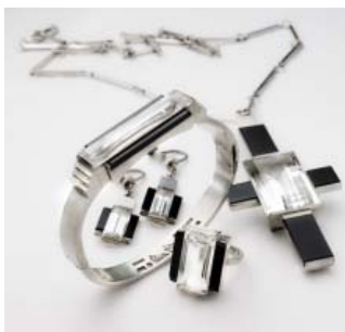
Tidslinje – nr 21