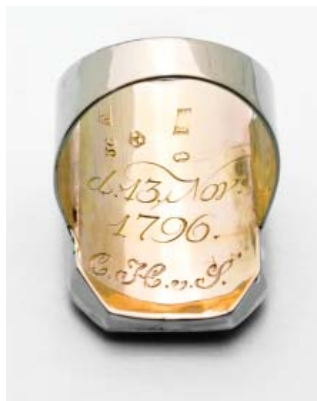
Guld-korn- nr 4