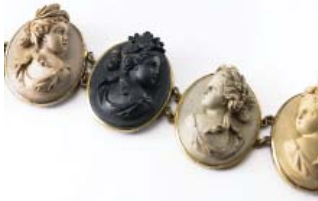
Guldkorn – nr 15