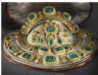
Guldorn - nr 1