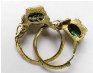
Guldorn - nr 6