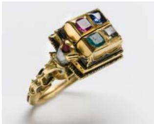
Guldorn - nr 6