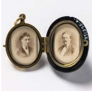
Guldkorn – nr 17