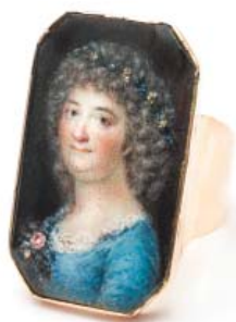
Guld-korn- nr 4