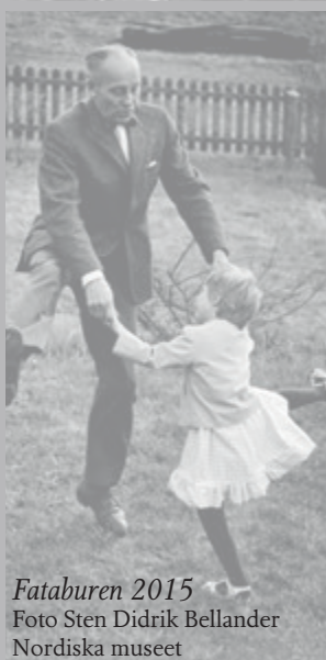
Fataburen 2015