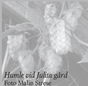
Humle vid Julita gård