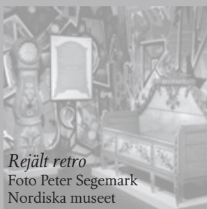
Rejält retro