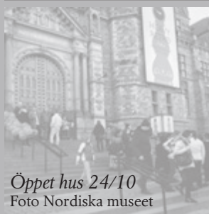
Öppet hus 24/10