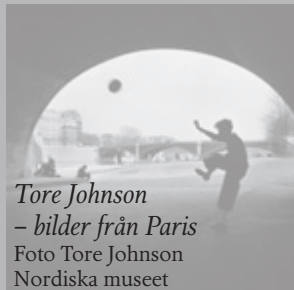
Tore Johnson – bilder från Paris